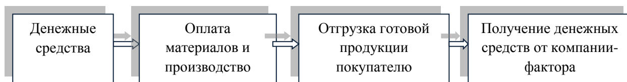
Рис. 2 - Движения денежных средств с использованием факторинга

На рис. 1 и 2 видно, что использование услуги факторинга позволяет компании избежать траты времени на ожидание оплаты от покупателя. При этом, время ожидания, в деятельности компании без использования факторинга, не всегда сопровождается получением денежных средств, так как могут возникнуть непредвиденные обстоятельства, которые вызовут задержку оплаты от покупателя, что неблагоприятно повлияет на показатели оборачиваемости компании [3].