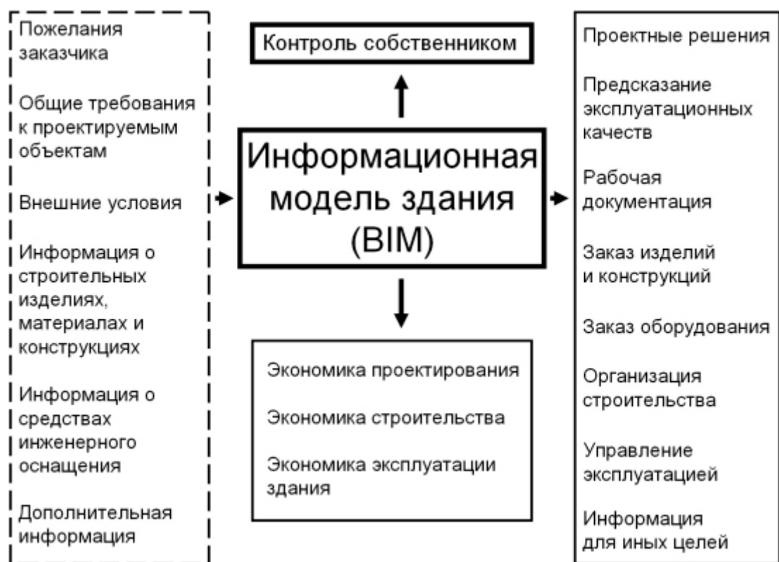
Рис. 1 - Основная информация, проходящая через BIM и имеющая к BIM непосредственное отношение.

Таким образом, BIM - это вся, имеющая числовое описание и нужным образом организованная информация об объекте, используемая как на стадии проектирования и строительства здания, так и в период его эксплуатации и даже сноса.