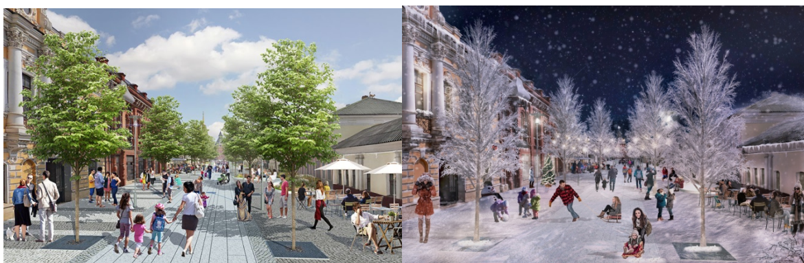
Рис.4. Проект музейного квартала на ул. Металлистов в г. Тула (лето-зима)

расположены образовательные учреждения и гостиницы. Открытые для транзитного движения пешеходов благоустроенные дворы связали ул. Металлистов с набережной. Эти внутренние пространства смогут работать как многофункциональные промежуточные пространства: выставочные, событийные, образовательные площадки. Квартал стал главной точкой притяжения для горожан и представителей бизнеса и сделал историческую часть города обитаемой и интересной [6].