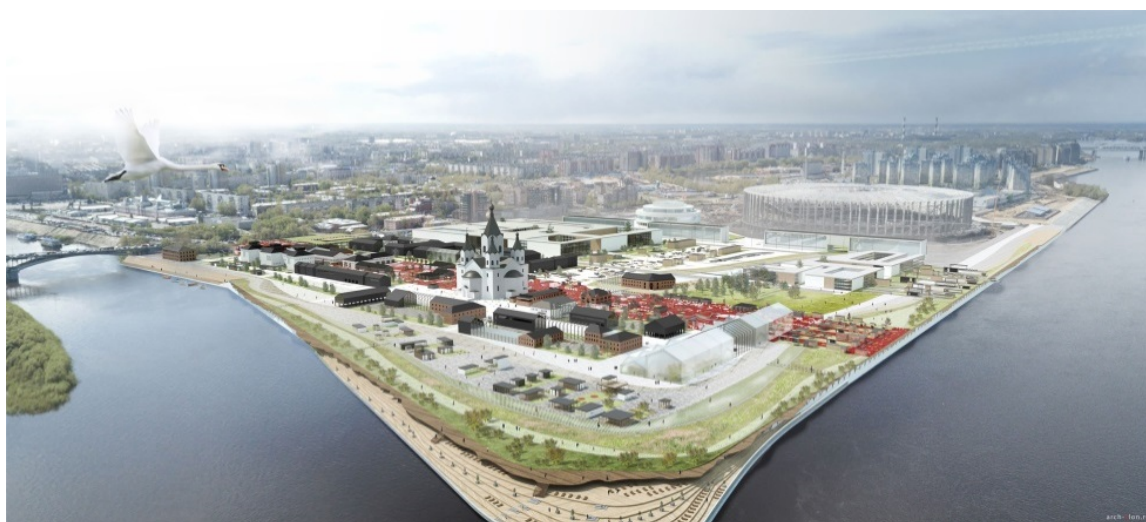
Рис. 2. Вид на Нижегородскую стрелку и зону «Макарьевской ярмарки»

проекта регенерации зоны стало возрождение принципов и духа «Макарьевской ярмарки». Территория ярмарки представлена квартальной застройкой в центральной части и отдельно стоящими павильонами в прибрежной зоне. Новые проектируемые кварталы сформированы из сохранившихся ценных исторических зданий, новых сооружений и открытыми площадками с мощением и линейным уличным оборудованием, с малыми архитектурными формами. Основным элементом территории Стрелки стала «Красная линия», являющаяся линейным продолжением основной торговой функции места, расположена на основной композиционной оси главного исторического здания Нижегородской Ярмарки. Здесь расположены небольшие павильоны, фонтаны, лавки, площадки для открытых выставок (рис. 2,3).