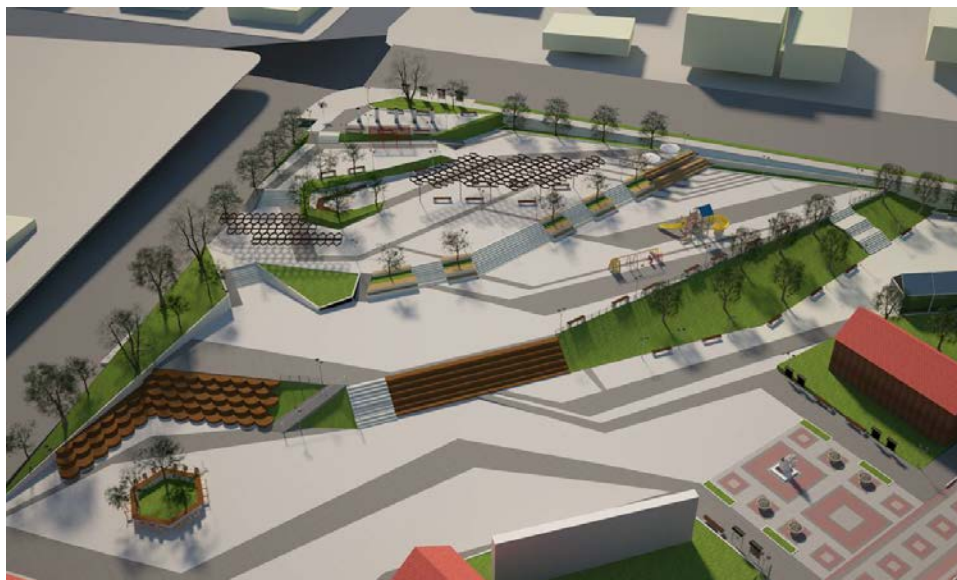
Рис. 6. Вид на террасную зону

Исторические кварталы и комплексы музеев под открытым небом сегодня являются мощным сегментом туристского бизнеса. Особенно актуальным на сегодняшний день является регенерация исторической городской среды как центра притяжения и комфортного пребывания жителей и гостей города.