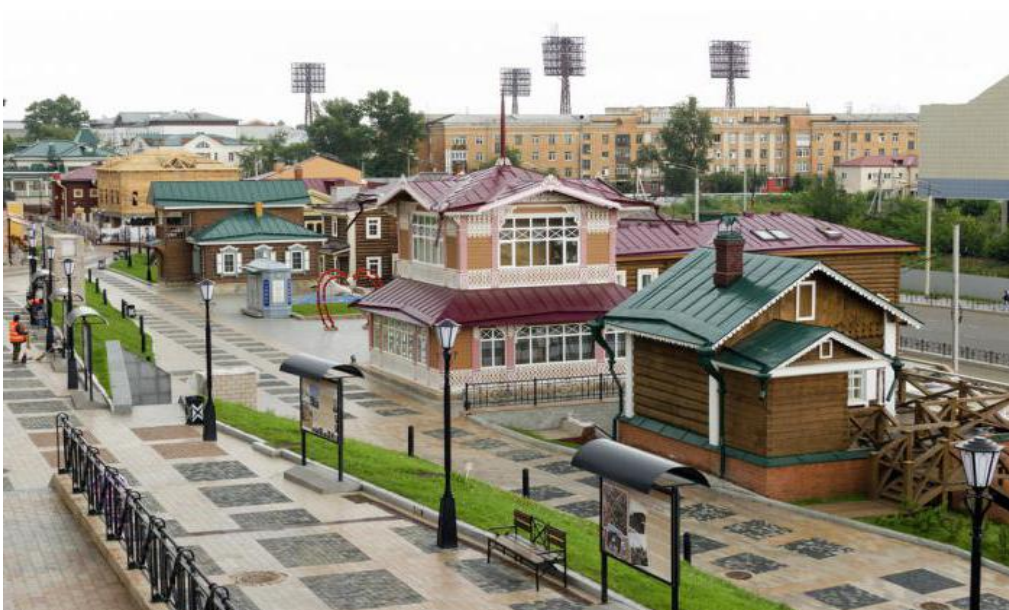
Рис.1-130-й квартал в Иркутске («Иркутская слобода»)