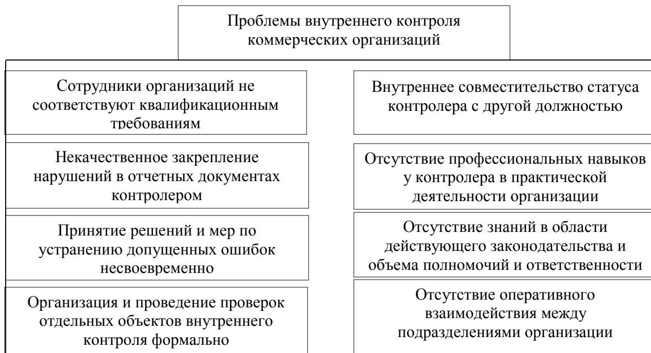
Рис.1 – Проблемы внутреннего контроля коммерческих организаций

Для решения данных проблем предлагаем следующую поэтапную схему внутреннего контроля для коммерческих организаций (рисунок 2).