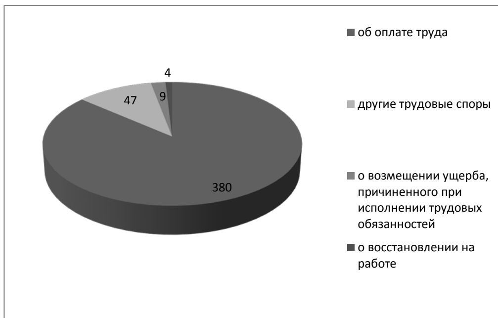
Рисунок 2 – Структура трудовых споров в 2018 году [3]

Большинство трудовых споров связано со спорами по оплате труда, так как проблемы оплаты труда являются для работников наиболее важными и жизненно актуальными.