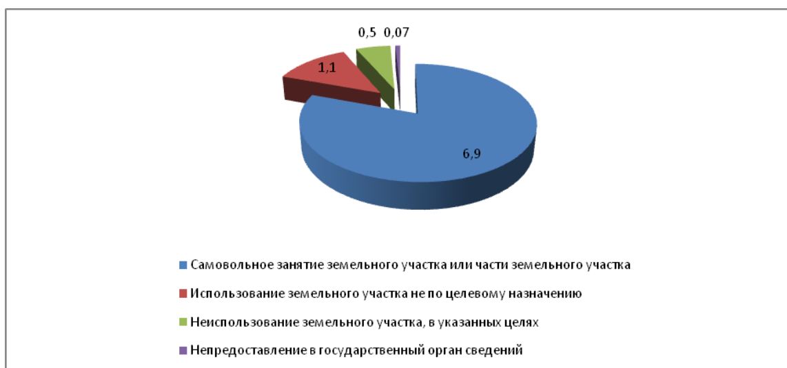
Рис. 2 – Общее количество нарушений земельного законодательства за 2019 г., в процентах (%)

При изучении всех видов нарушений земельного законодательства Российской Федерации было выявлено, что число нарушений за самовольное занятие земельного участка или части земельного участка составляет 69574 (количество ед.); использование земельного участка не по целевому назначению – 11627; неиспользование земельного участка, предназначенного для жилищного или иного строительства, в указанных целях – 5771; непредоставление в государственный орган сведений для осуществления его законной деятельности – 79 (рис. 2).