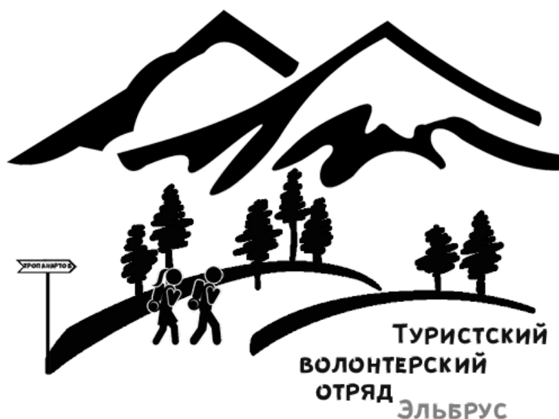
Рисунок 1. Логотип туристского волонтерского отряда 1 .

Проект реализуется с использованием гранта Президента Российской Федерации на развитие гражданского общества, предоставленного Фондом президентских грантов. Для реализации проекта было закуплено снаряжение для экипировки туристского волонтерского отряда, разработан логотип отряда (рис.1), изготовлена имиджевая атрибутика.