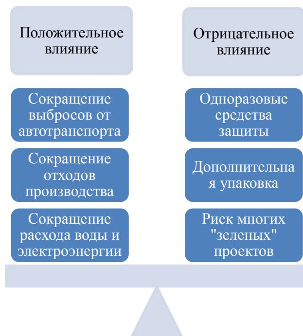
Рис. 1 – Положительные и отрицательные изменения

Рассмотрим более подробно каждый из выявленных нами аспектов. Сначала уделив внимание изменениям, оказывающим положительное влияние на экологическую обстановку.