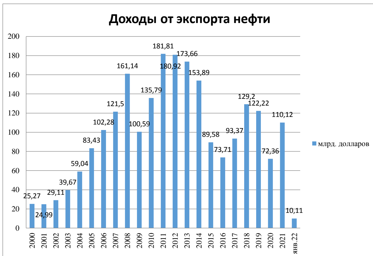
Рисунок 2 - Динамика доходов России от экспорта нефти 2010-2022 гг.

Таким образом, рекордных объемов экспорт нефти из России достиг в 2019г. По данному показателю РФ занимает 2 место в мире – после Саудовской Аравии. Крупнейшим потребителем российской нефти является Китай. По данным Главного таможенного управления КНР, в 2021г. поставки нефти из РФ достигли 79,64 млн. тонн на 40,29 млрд. долл. На рисунке 2 отражена динамика доходов России от экспорта нефти, (в млрд. долларов) по данным ФТС РФ [5].