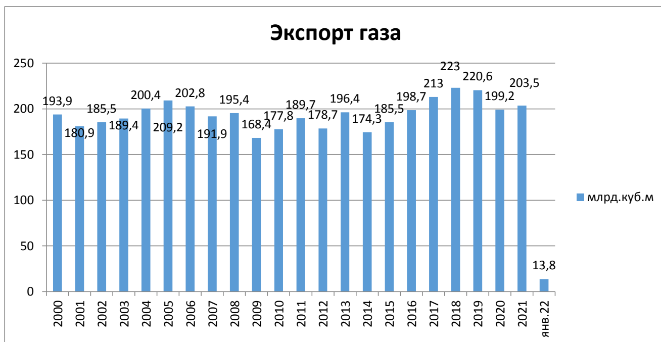
Рисунок 3 - Динамика экспорт природного газа из России по годам, 2000 – 2022 гг.

На рисунке 3 представлена динамика экспорт природного газа из России по годам, 2000 – 2022 (в млрд. куб. м.) по данные ФТС РФ и Росстата [6].