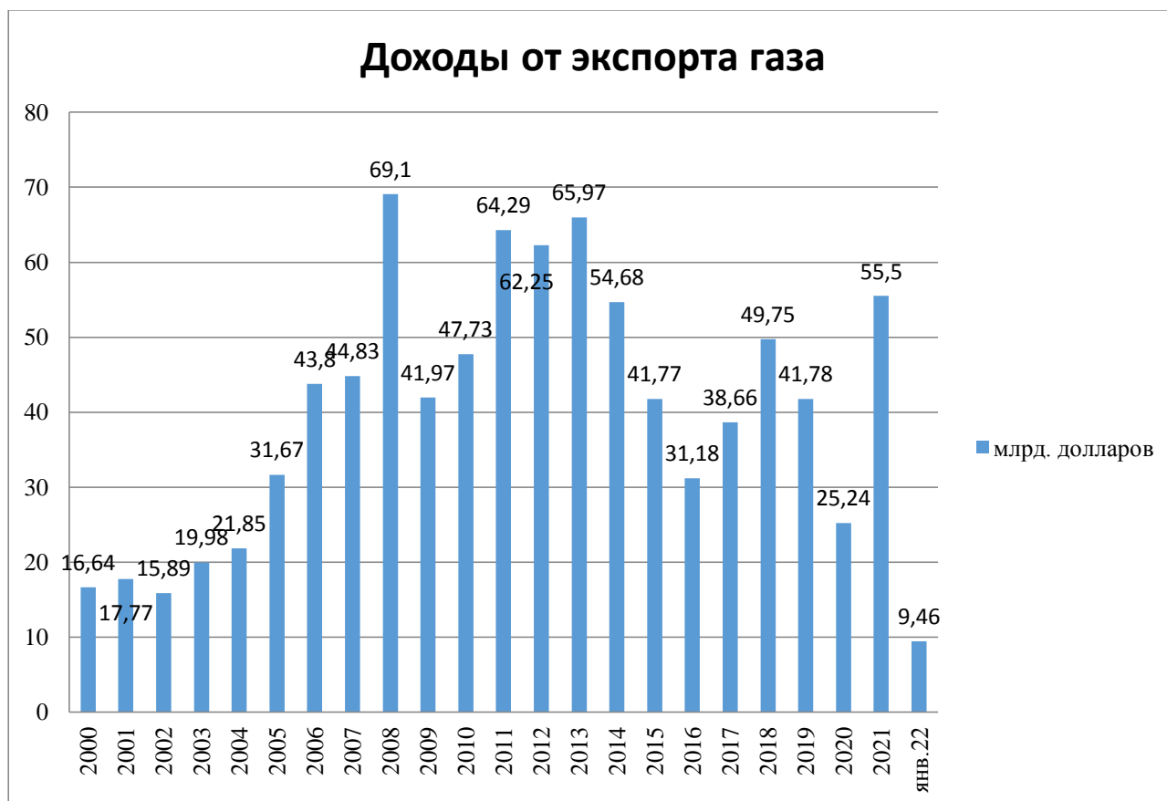
Рисунок 4 – Динамика экспорта газа в РФ 2000 – 2022 гг.

Таким образом, экспорт природного газа из России достиг рекордных объемов в 2018г. По данному показателю РФ занимает 1 место в мире.