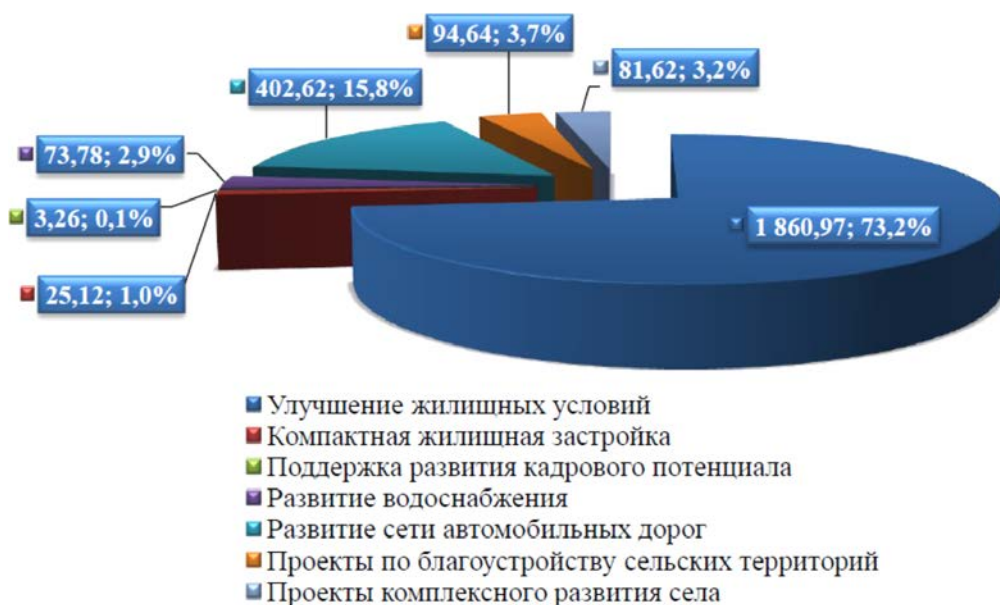
Рис. 2 – Состав и структура финансирования мероприятий в рамках комплексного развития сельскохозяйственных территорий в 2021 году, млн. рублей; %

На территории региона продолжалось строительство (реконструкция) 3 объектов водоснабжения на территории Баевского, Змеиногорского и Красногорского районов, велась разработка 3-х проектно-сметных документаций (объекты в Романовском, Тогульском и Топчихинском районах). В 2021 году планировался ввод объекта водоснабжения в с. Сереброполь Табунского района протяженностью 10 км, однако исполнение муниципального контракта продлено до 31.12.2022.