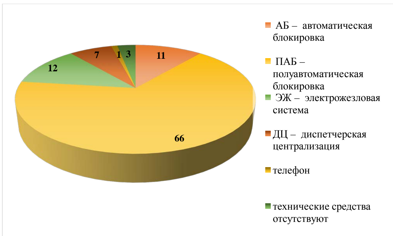
Рис. 3 – Оснащенность малоинтенсивных линий, % (прим. авторская разработка)

Важно обратить внимание, что существуют определенные ограничения, не позволяющие эффективно реализовать коммерческую и грузовую работы на малоинтенсивных железнодорожных линиях. Данные факторы включают: