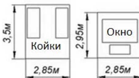
Рис. 2 - Планировка двухместной палаты. Прим. Авторская разработка

Структура двухместной палаты в чистом хирургическом отделении, отображенная на рисунке 2: глубина помещения составила 3,5 м, ширина – 2,85 м. Площадь двухместной палаты составила 9,975 м 2 , на одну койку приходится 4,98 м. Высота от пола до потолка составила 2,95 м. Глубина заложения палаты составила 1,4. Световой коэффициент составляет 0,64. Ориентация палаты оптимальная – ЮВ. Искусственная, вытяжная вентиляция в палате отсутствует. Цвет стен – бледно-желтый, поверхность стен гладкая, ровная. Температура составила 24°С. Относительная влажность по психрометрическому гигрометру – 78%. Подвижность воздуха составляет 0,08 м/с. Освещенность согласно данным люксметра 100 лк. В двухместной палате используются люминесцентные лампы.