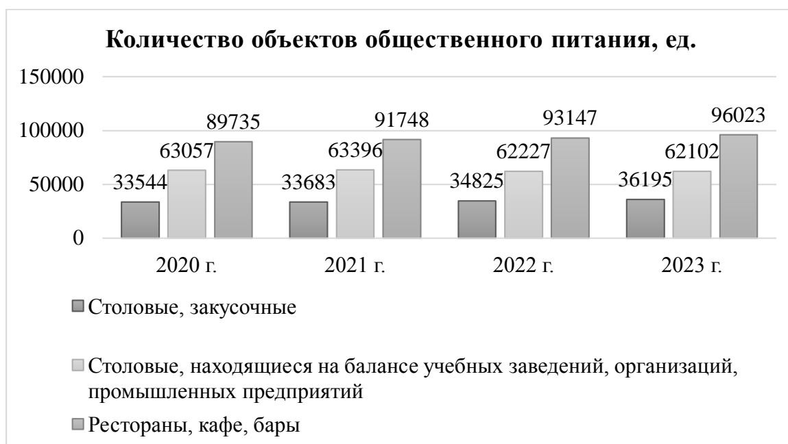
Рис. 1 – Количество объектов общественного питания на территории Российской Федерации в период 2020-2023 гг., ед. [4]

На рис. 1 представим динамику количества объектов общественного питания в 2020-2023 гг.