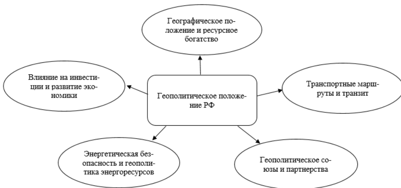
Рис. 1 – Влияние геополитического положения РФ на сферы экономики [авторская разработка]

Как говорилось выше, Россия обладает обширными запасами природных ресурсов, особенно в области энергетики, именно они играют важную роль в экономике страны. Так Россия является одним из крупнейших производителей и экспортеров нефти и природного газа в мире. Эти ресурсы обеспечивают значительную часть доходов страны. Высокий спрос на эти продукты на мировом рынке позволяет России получать высокие экспортные доходы, что важно для финансирования других секторов экономики. Многие страны зависят от российских поставок нефти и газа, что может использоваться в качестве инструмента внешней политики, Россия в свою очередь сама обеспечивает энергетические потребности внутри страны, что говорит о ее энергетической независимости, а доходы от экспорта газа и нефти в другие страны используются для поддержания бюджета страны, а также для модернизации экономики. Также Россия активно инвестирует средства в инфраструктуру для добычи нефти и газа, что способствует развитию технологий и увеличению рабочих мест. Россия развивает свою диверсификацию, вкладывая средства в атомную энергетику,